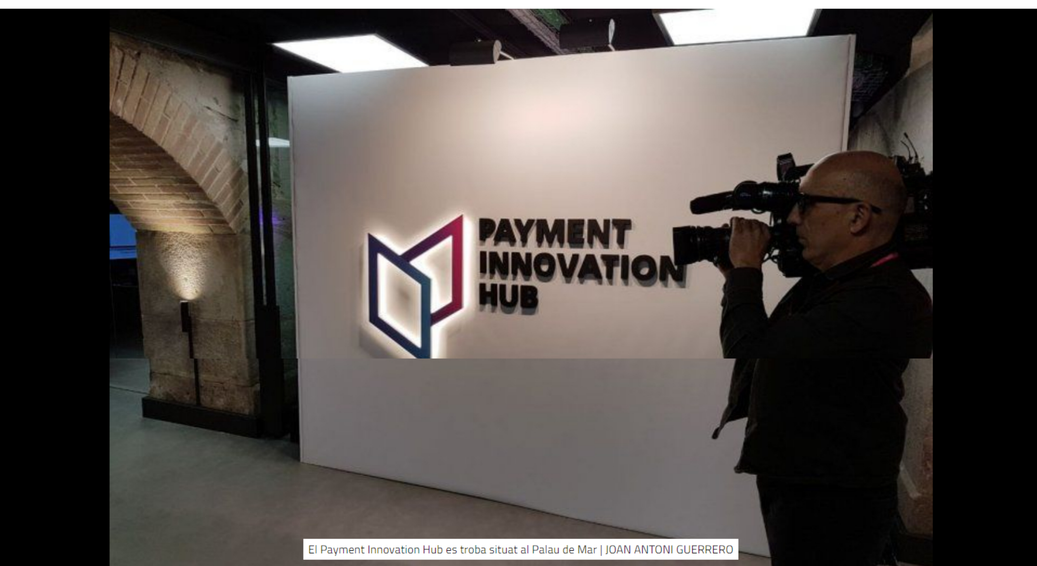
El Payment Innovation Hub es troba situat al Palau de Mar | JOAN ANTONI GUERRERO

per Joan Antoni Guerrero Redactor 27 de novembre de 2017 13:30