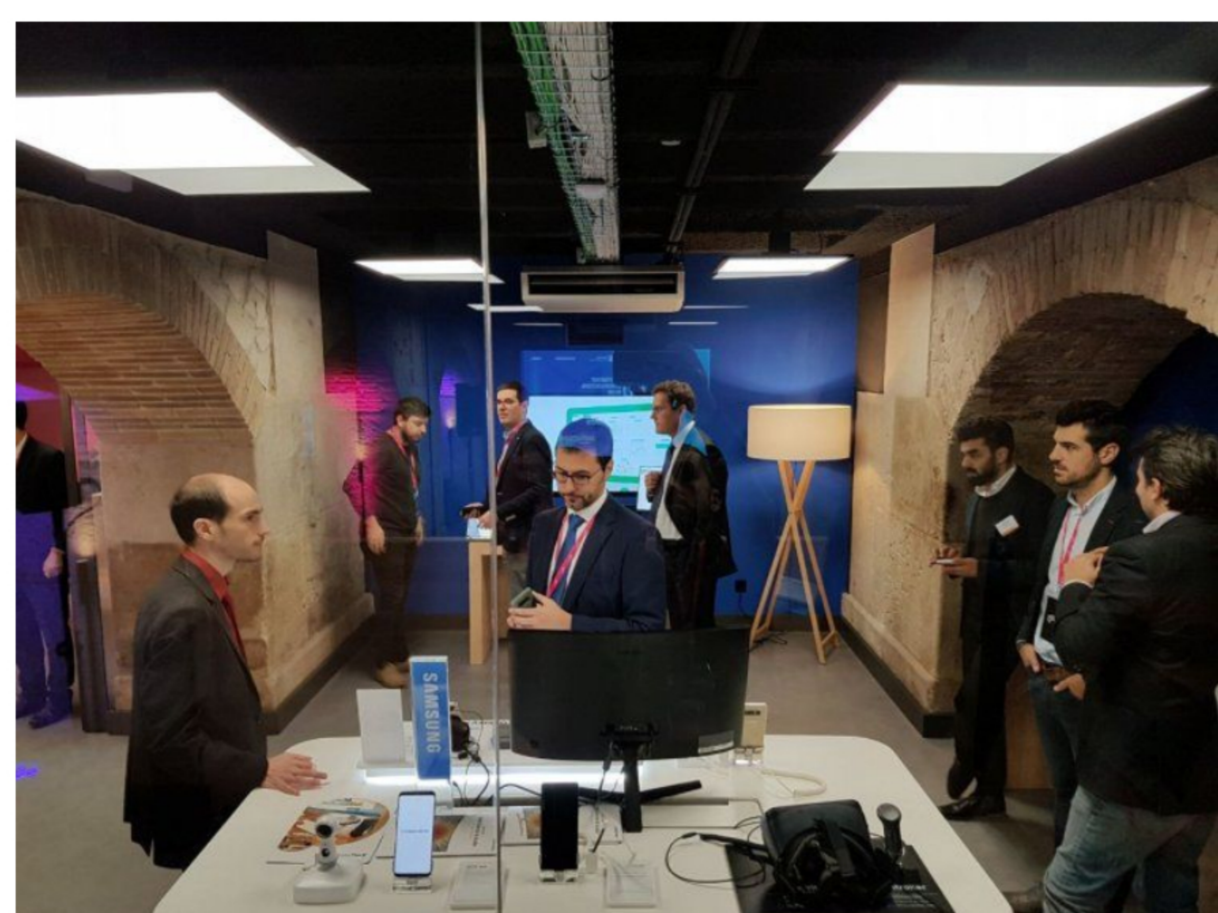
Espai de mostra de prototips

per Joan Antoni Guerrero Redactor 27 de novembre de 2017 13:30