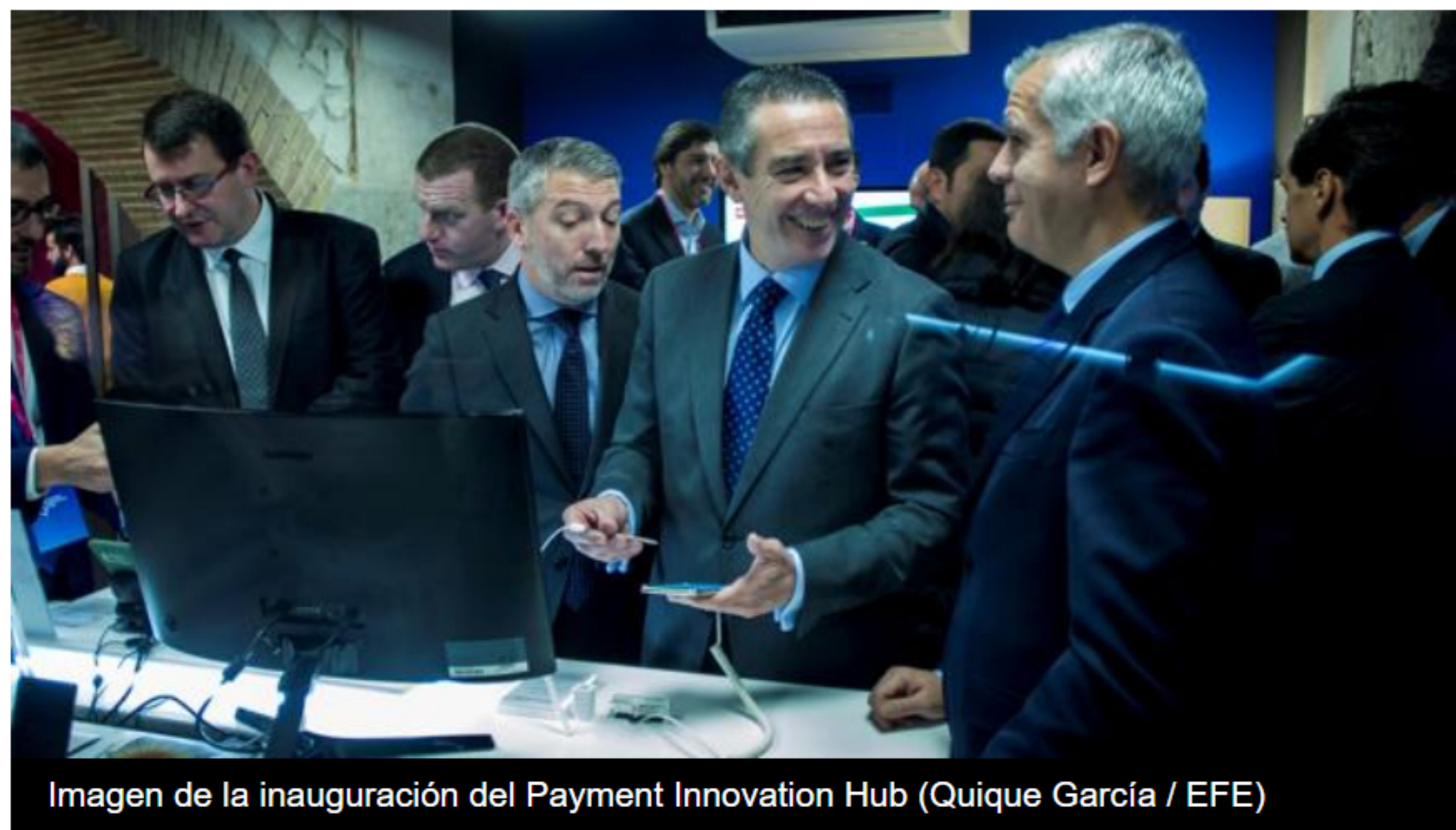
Imagen de la inauguración del Payment Innovation Hub