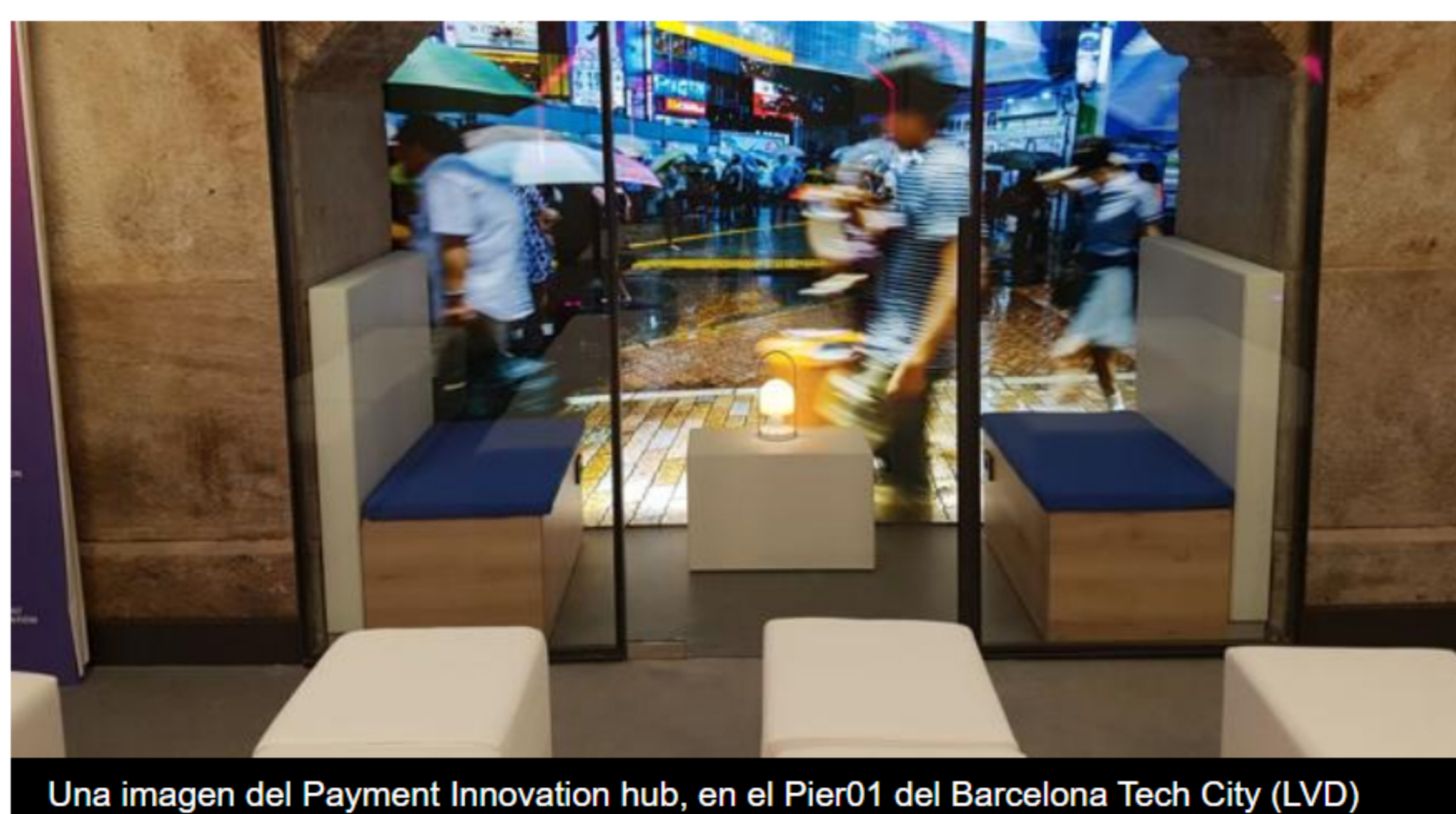
Una imagen del Payment Innovation hub, en el Pier01 del Barcelona Tech City

En uno de los espacios del nuevo Hub, las compañías presentaron diversos proyectos en los que ya han trabajado. CaixaBank exhibió innovaciones como la conversión de móviles en datáfonos o los últimos terminales de punto de venta (TPV) en restauración; Samsung el DeX, que transforma móviles en CPUs; Arval un software para la gestión y control de flotas; y Visa la aplicación de la inteligencia artificial en los pagos de la vida diaria. El futuro de los pagos también es presente.