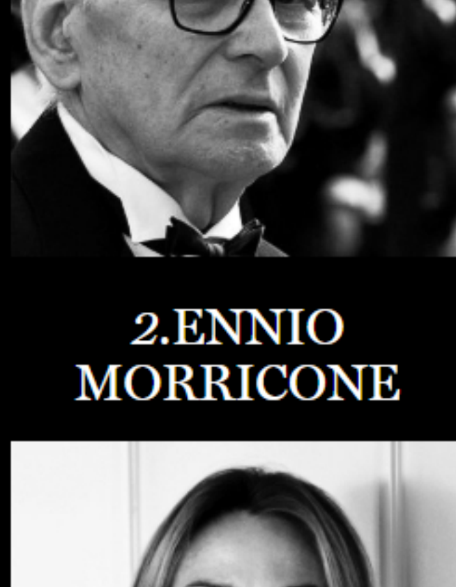
2. ENNIO MORRICONE