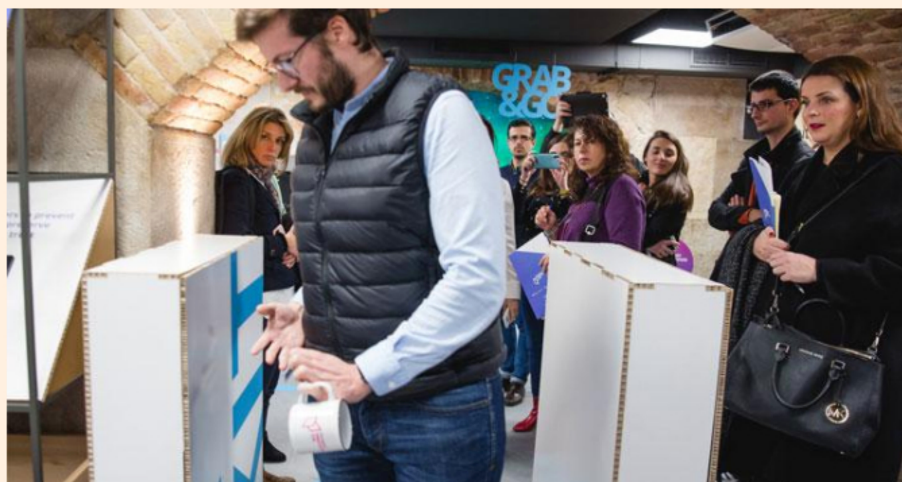
La experiencia del 'Grab and Pay' en el Payment Innovation Hub de Barcelona / CG

¿Cómo se realiza el pago? De forma parecida a cómo se desbloquea un teléfono móvil o una tableta. Se abonará el ticket a través de una aplicación que estará instalada en un dispositivo . Los usuarios deberán darse de alta en la plataforma que permitirá este pago invisible . El registro implica cargar cinco fotografías distintas de la persona que permita al sistema obtener los rasgos necesarios para identificar a una persona incluso con pequeños cambios como el uso de gafas, de bufanda o estrenar un peinado.